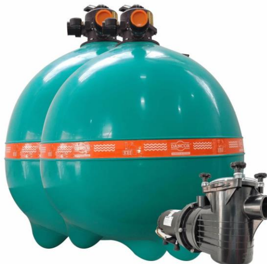
Figura 2- tabela de dimensionamento de filtro /Bomba